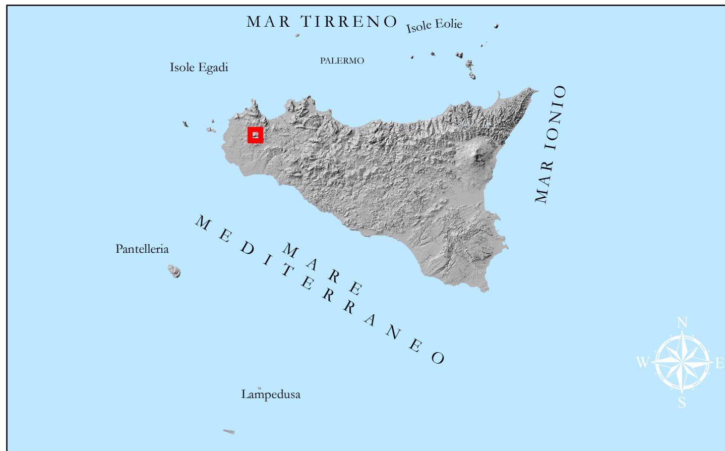
Tavola 2 di 2 Scala 1:10.000